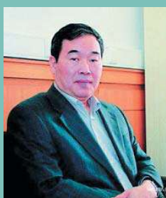
蒲慕明老師 中國科學院 上海神經科學研究所