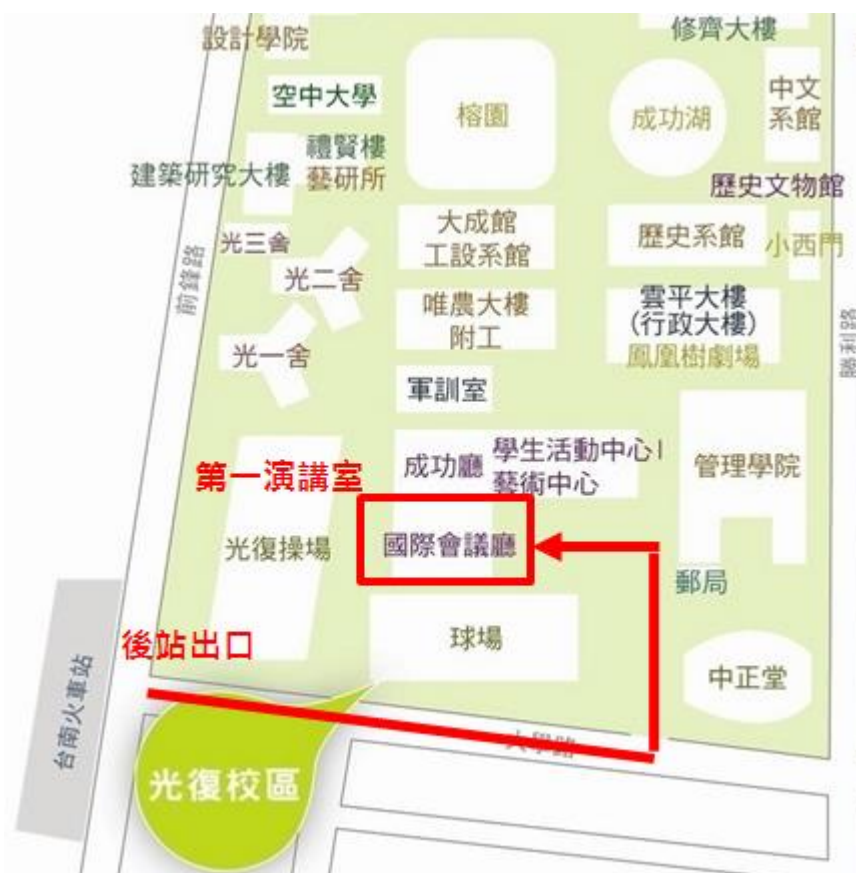
圖 1 成功大學位置圖