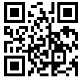
報名頁面 QR CODE