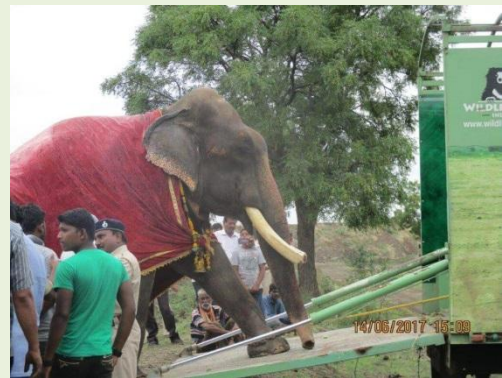
上圖：Gajraj 被鍊乞討受虐 51 年