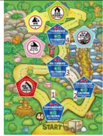
(上圖為所有磁鐵相對應擺放圖樣)

3. 再將五組鑰匙放置於左側箱面上，並將貼有 (R) 字樣的密碼鎖頭將遊戲箱上鎖，即準備完成。