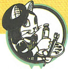
山本修 Shu Yamamoto

進入這座《貓·美術館》的各位，除了觀賞貓畫，還會不自覺地受到喵化魔法的影響，將從貓的視角重新去認識世界，變身成為貓界的一員。