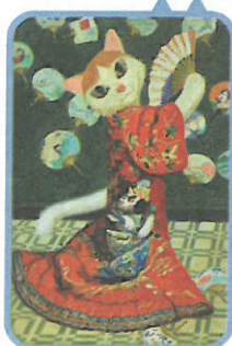
《穿和服的卡貓兒》喵內