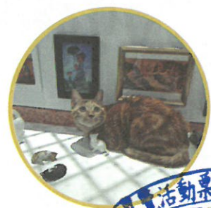
※圖為海外展出照片，依現場實景為準。