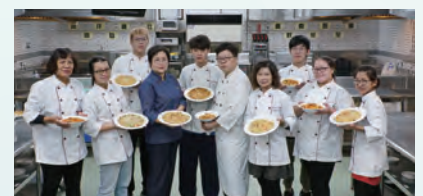
晶英酒店主廚業師協同教學