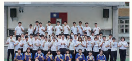
4張以上證照達人合照