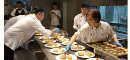
學生辦理感恩餐會