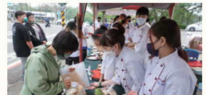
畢業成果展-伴手禮市集