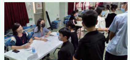
建教合作廠商面試