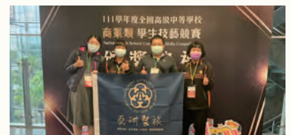
商業類科技藝競賽雙優勝