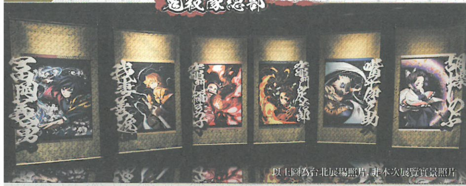
以上圖為台北展場照片，非本次展覽實景照片