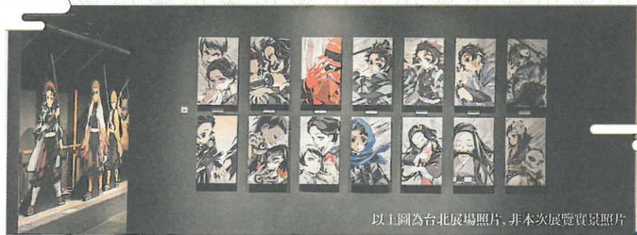
以上圖為台北展場照片，非本次展覽實景照片