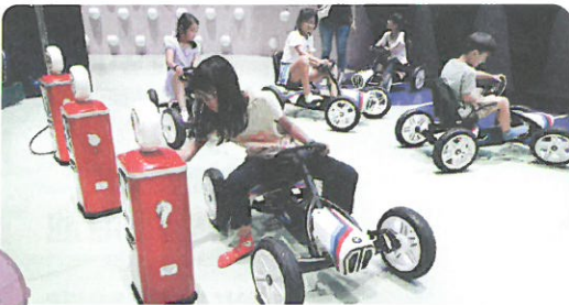
專屬孩子的競速賽道