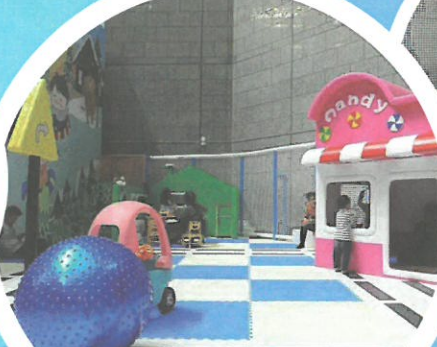
烘培坊 / 糖果屋