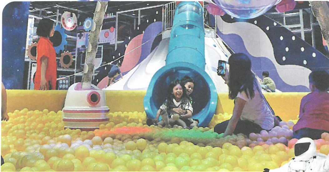
與孩子們一起來場銀河冒險體驗~