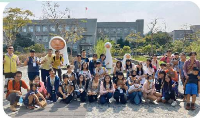
▲109學年度美感教育閱讀活動