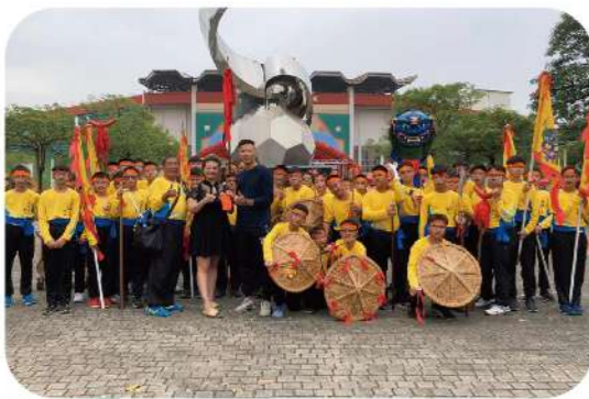
▲109年武術隊參加傳統藝術競賽 榮獲傳統藝陣優等佳績