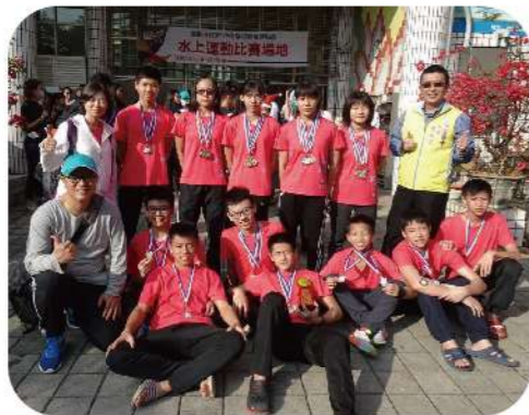
▲109市中運游泳隊榮獲 國男國女總錦標雙料亞軍