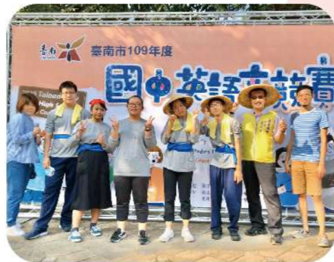
▲109學年度國中英語文競賽成績優異