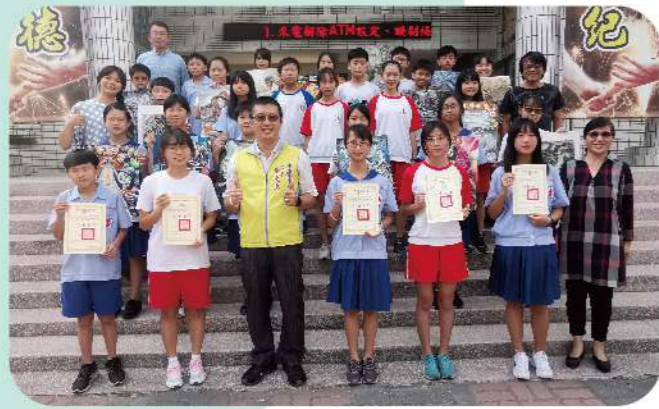
▲109學年度美術比賽得獎件數居南市之冠