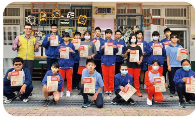
▲109學年度合作盃英語文單字王比賽得獎學生