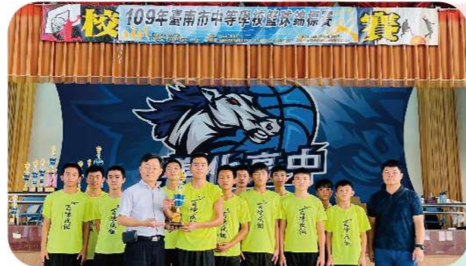
▲109年籃球隊榮獲中等學校籃球錦標賽第五名