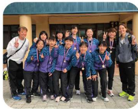
▲109年市中運羽球隊表現優異 取得全國比賽資格賽