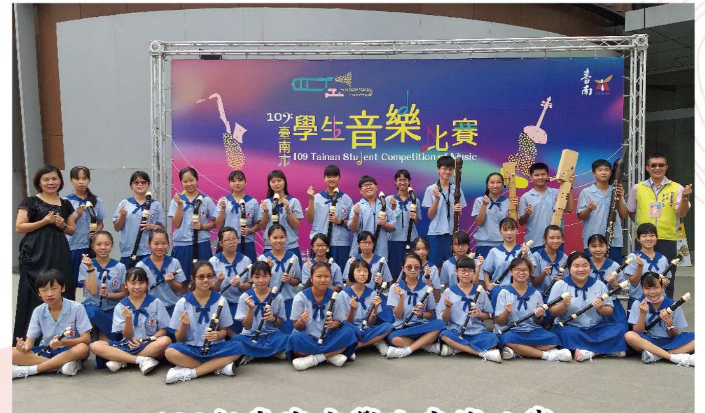
109年臺南市學生音樂比賽 直笛合奏國中組優等

YONG KANG JUNIOR HIGH SCHOOL 永續·健康·本位·國際·多元·合作