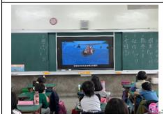
照片說明：學生欣賞「 低碳永續家園 」教學影片，藉以瞭解不好好保護地球會帶來什麼樣的危害。 4