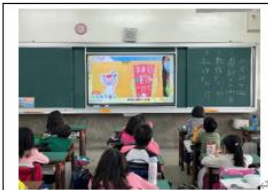
照片說明：學生欣賞「來自北極的一封信」繪本故事教學影片。 4