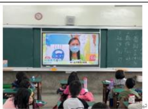
照片說明：「來自北極的一封信」繪本故事中告訴我們如何從生活中減碳。 4