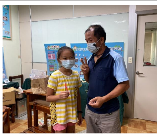
說明:學生與講師合影