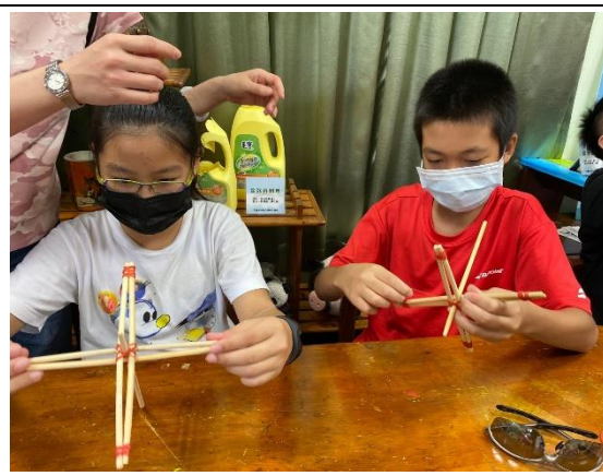
說明:學生實際上手