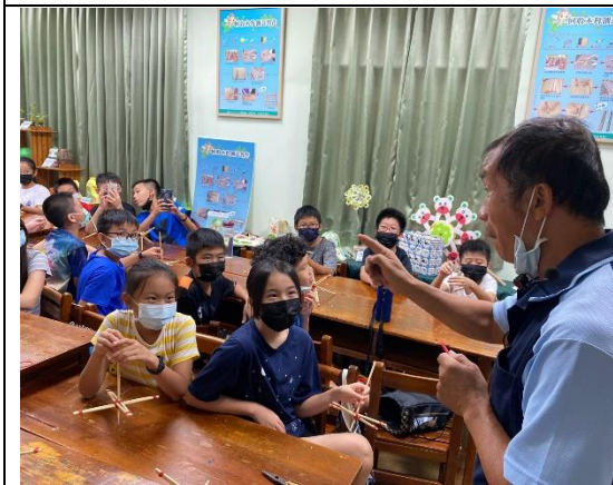
說明:老師講解製作過程