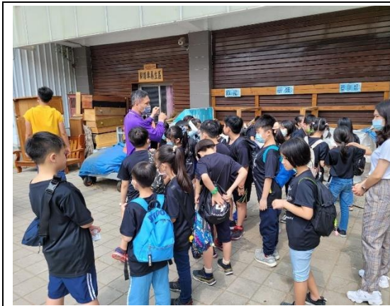
說明：戶外教學參觀