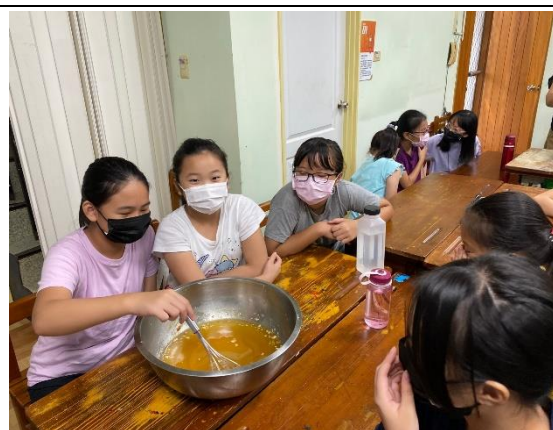
說明:學生實際上手