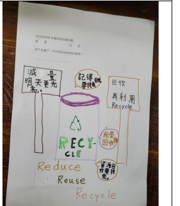
說明：學生參觀後心得 2