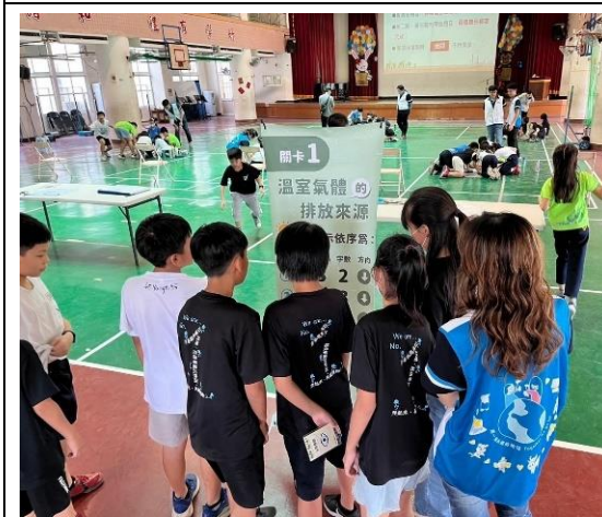
說明：學生實際活動 2