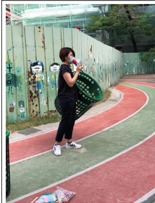
說明：老師講解垃圾分類