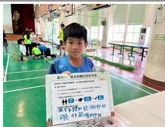
說明：活動遊戲規則