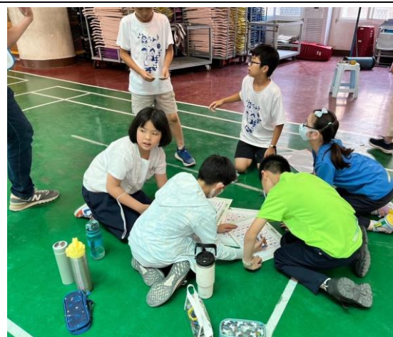
說明：學生實際活動 3