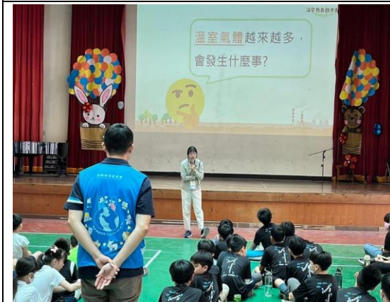
說明：老師講解說明