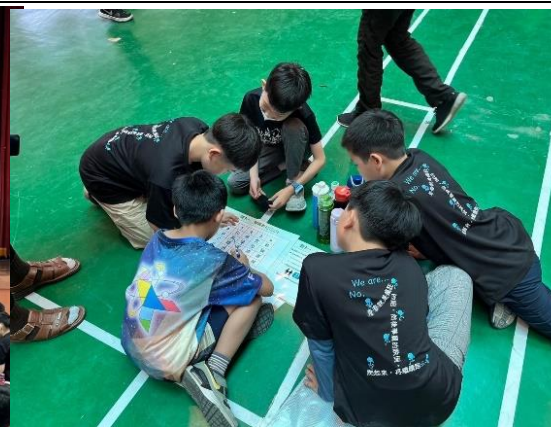
說明：學生實際活動 1