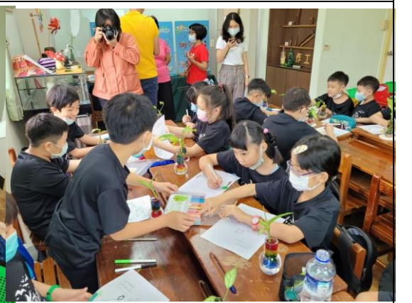
說明：學生實際上手