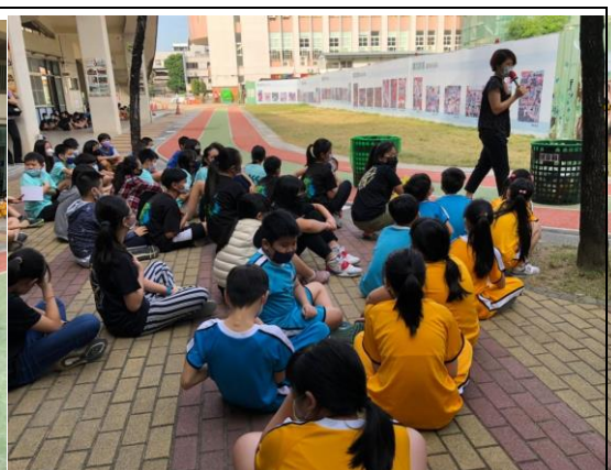
說明：老師講解垃圾分類