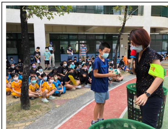
說明：學生實際分類