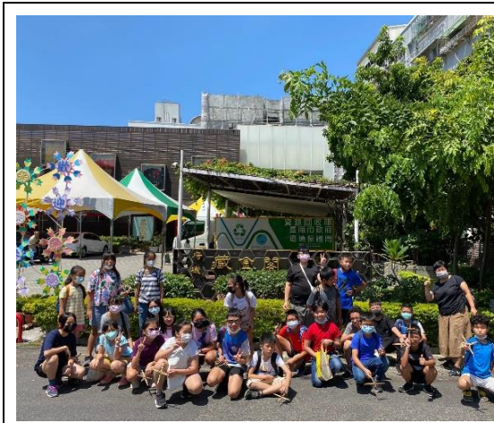
說明:參加班級合影