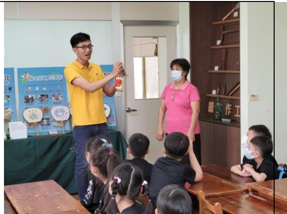
說明：講師講解說明