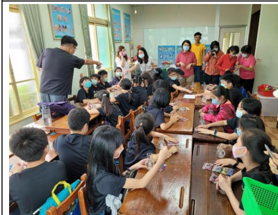
說明：老師講解製作過程