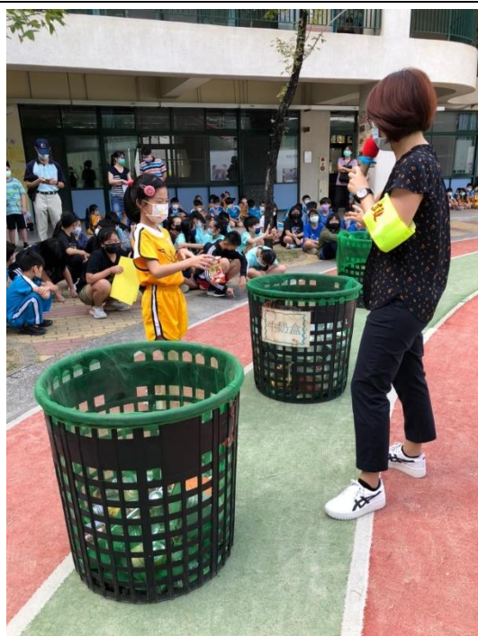
說明：學生實際分類