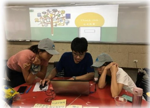
教案活動設計指引撰述