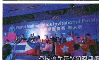
各國選手齊聚頒獎典禮