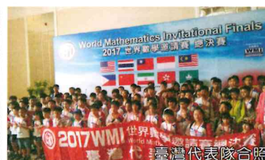
2017 WMI 世界數學邀請賽 臺灣代表隊合照