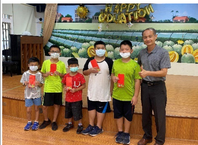
說明：為弱勢族群申請獎助學金。