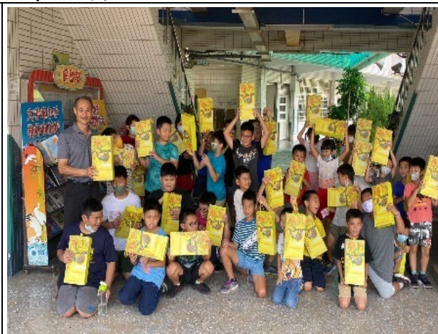
說明：增取外來資源協助弱勢族群。