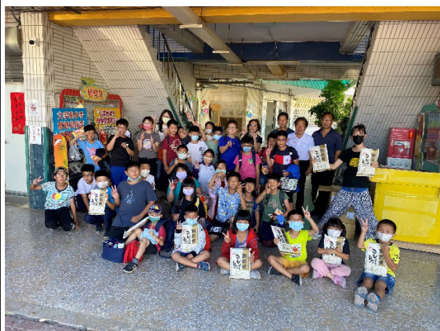
說明：東隆宮捐贈米。