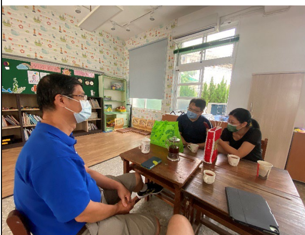
說明：企業捐贈經費提供多元社團活動。