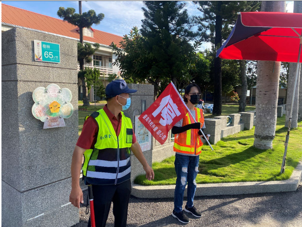
配戴導護裝備值勤