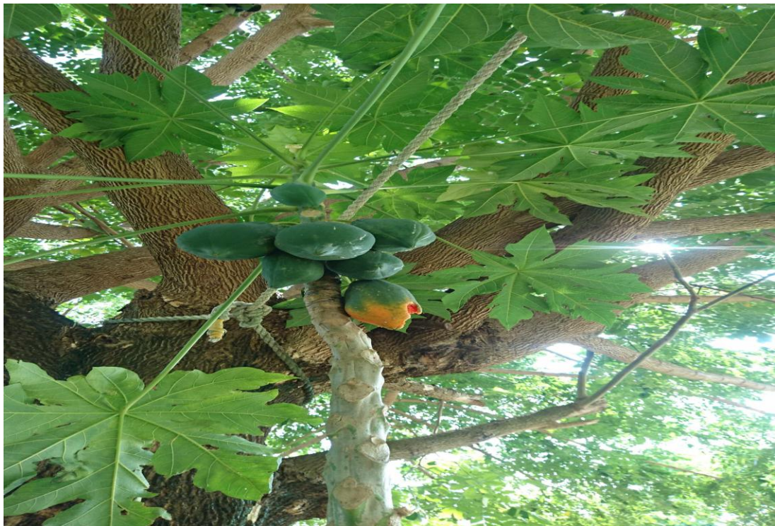
新化國中蔬果實驗園區第3區