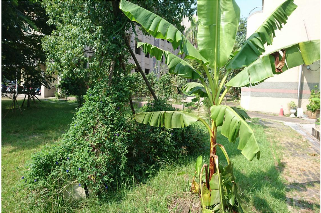
新化國中蔬果實驗園區第3區