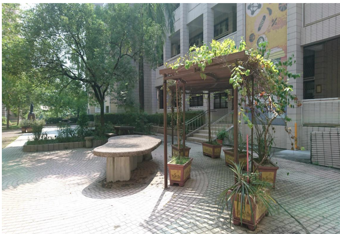
圖書館前廣場空地設置涼亭