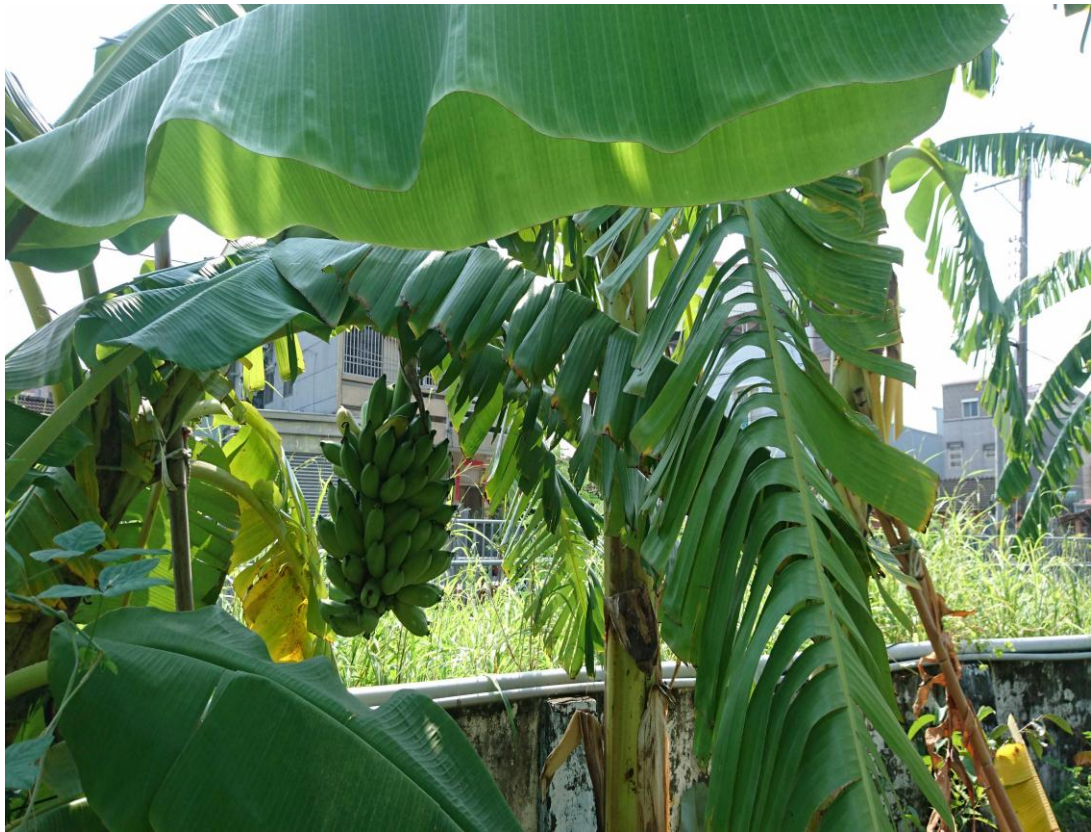
新化國中實驗蕉園第2區