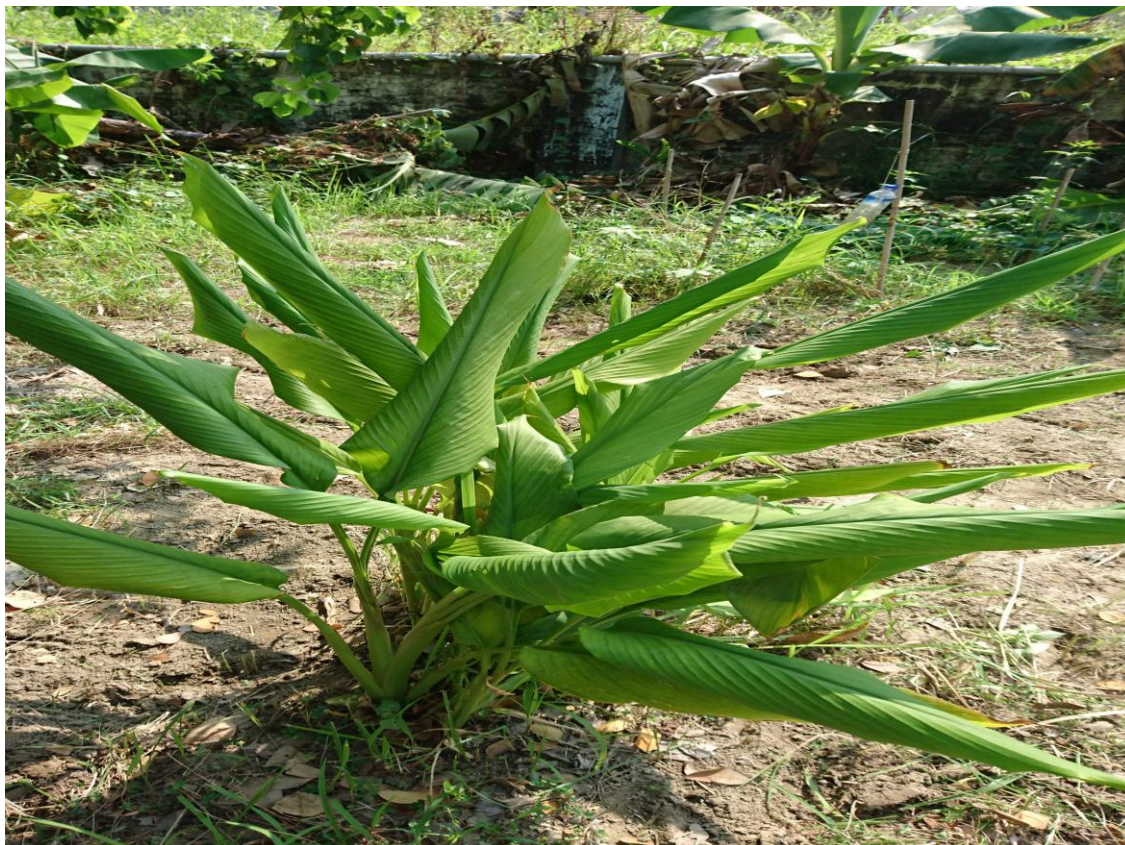
新化國中蔬果實驗園區第2區 上圖是薑黃