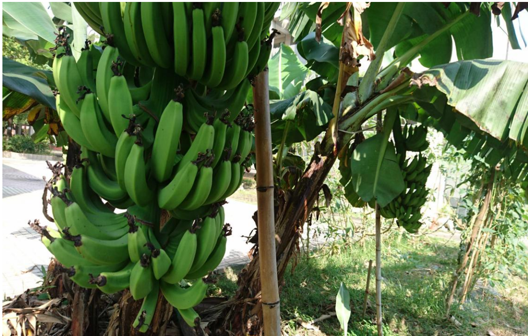
新化國中實驗蕉園第1區