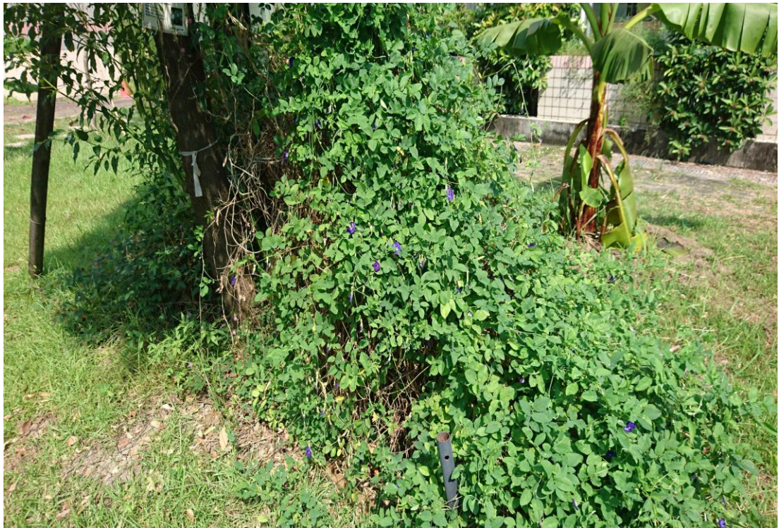
猜猜這是什麼植物？（可泡茶喔~）