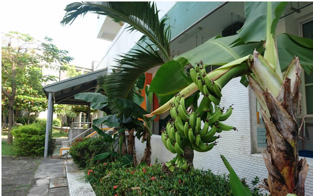
新化國中蔬果實驗園區第4區-特教快樂農場