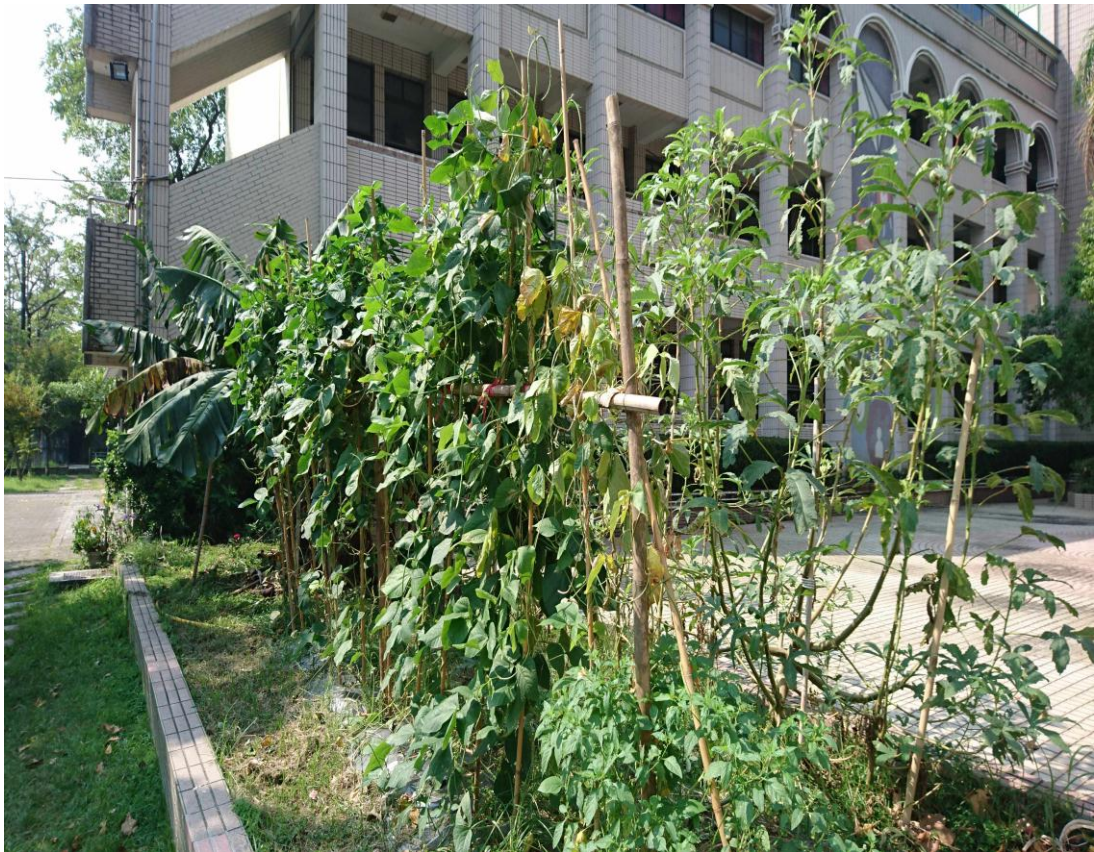
新化國中蔬果實驗園區第3區