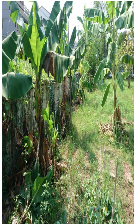
新化國中實驗蕉園第2區-香蕉吃不完