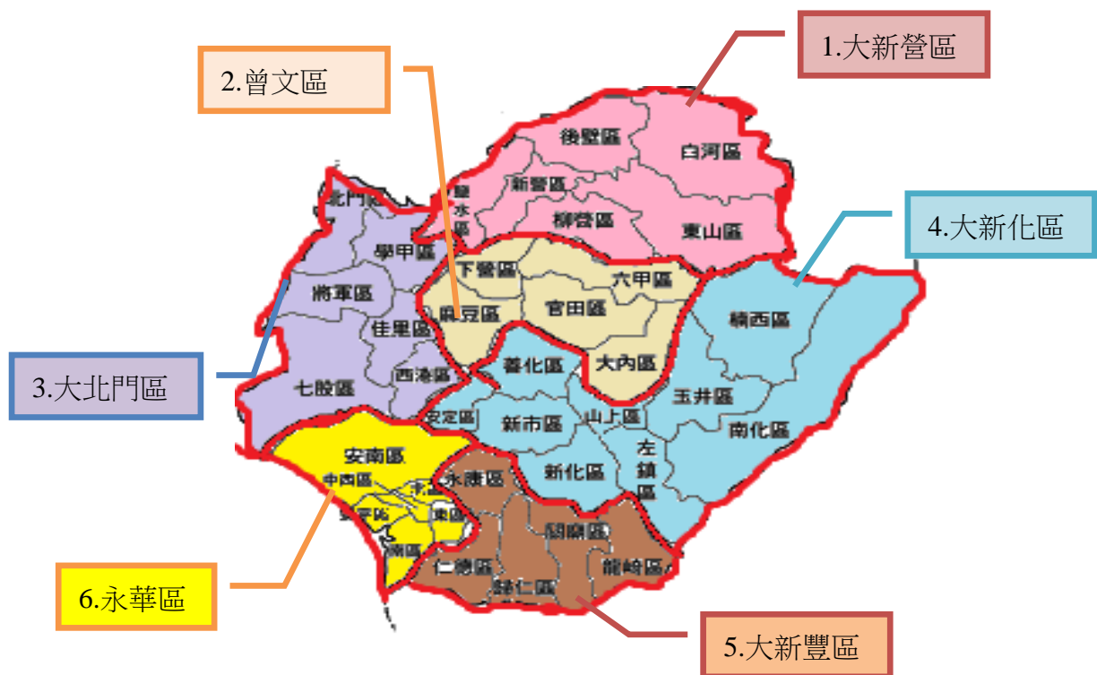
臺南市 6 大行政區及 37 個區域圖