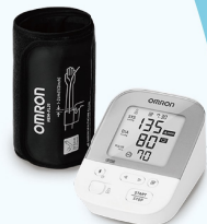
藍牙電子血壓計3名