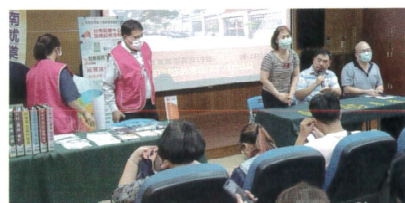
進修部學生媒合就業