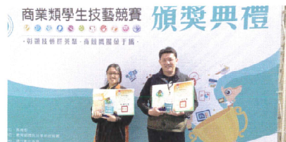
商業類科技藝競賽金手獎