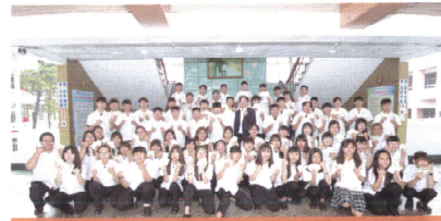
4張以上證照達人合照