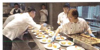
學生辦理感恩餐會