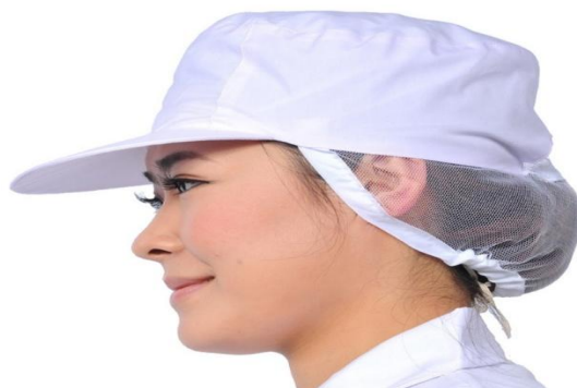
↑ 衛生帽：頭髮要完全包覆在帽內。