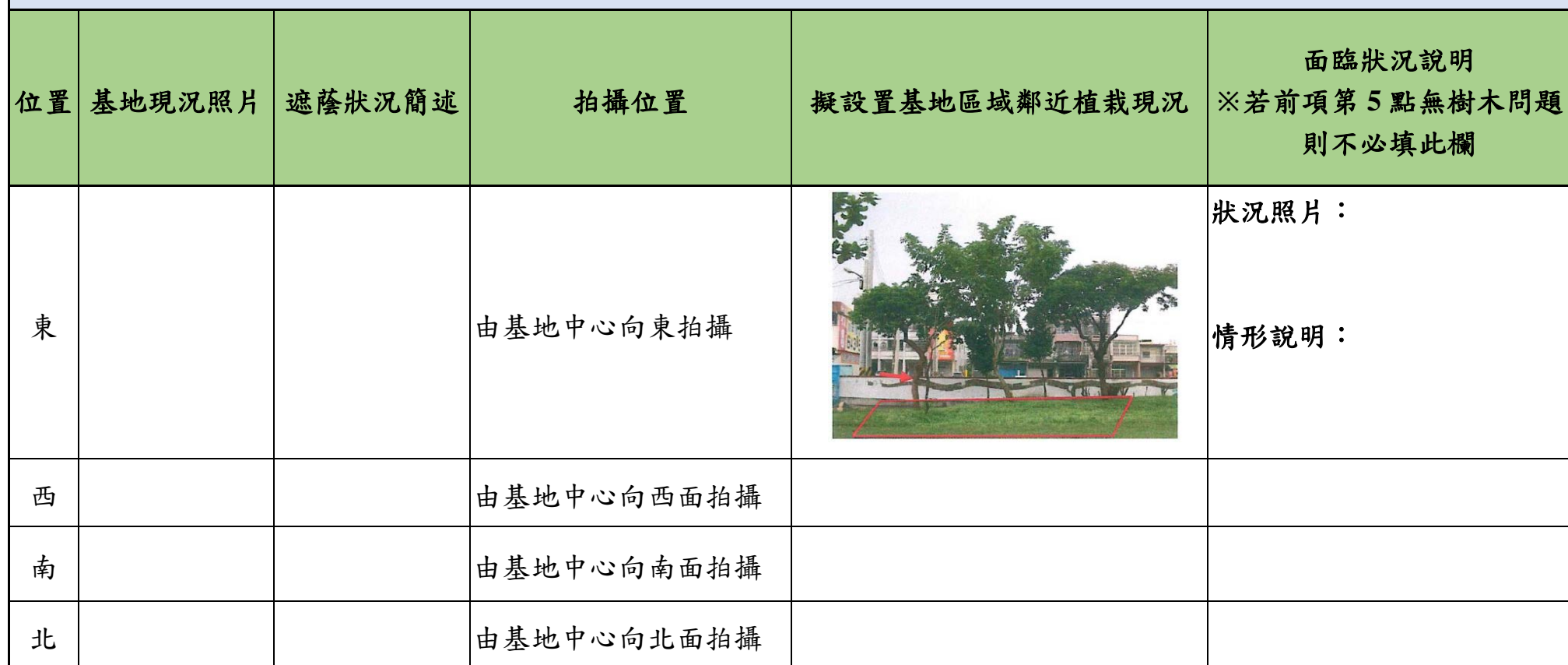
擬設置基地現況可行性自我評估檢核表