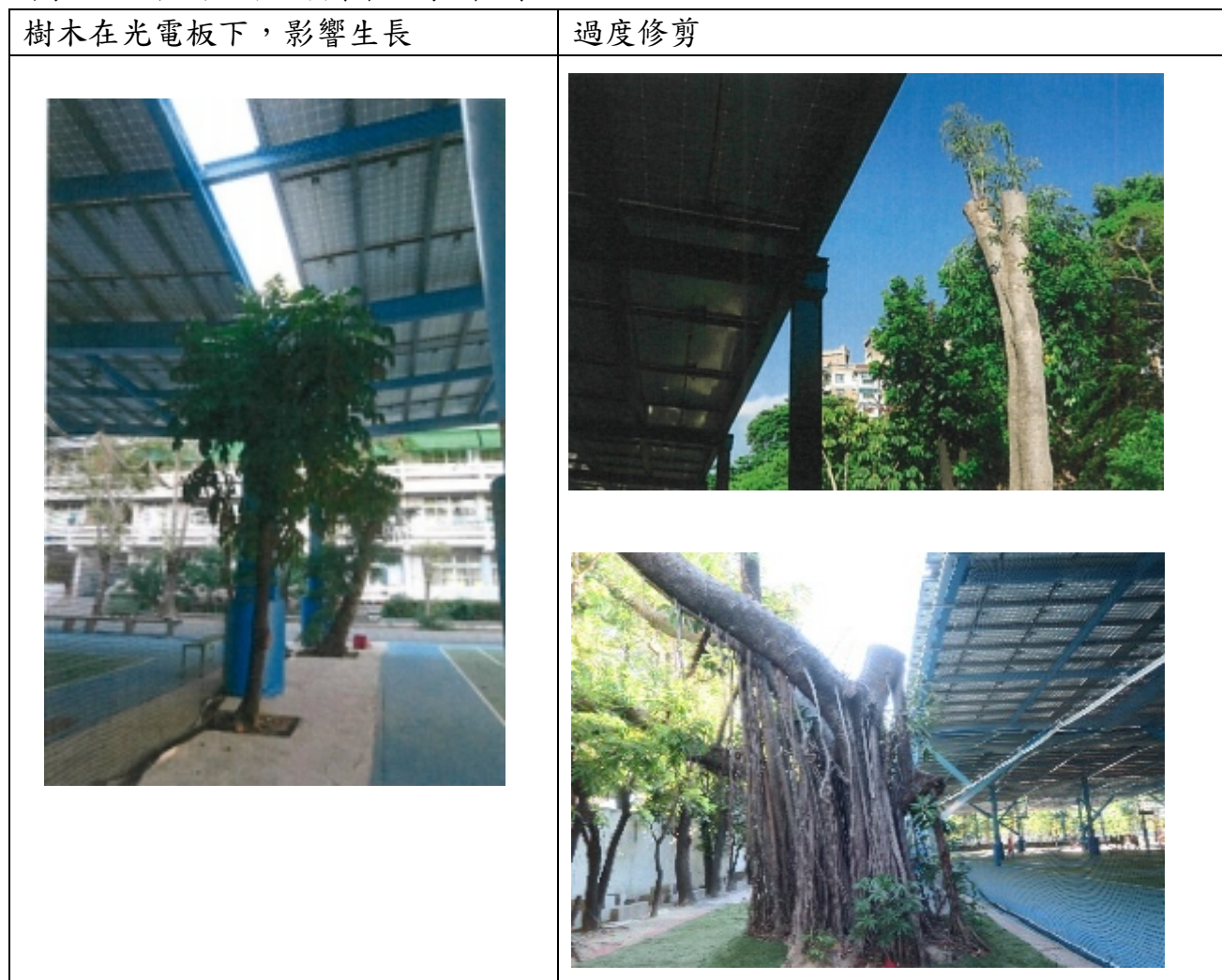
附表 2-7 不利於校園樹木生長案例