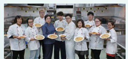
晶英酒店主廚業師協同教學