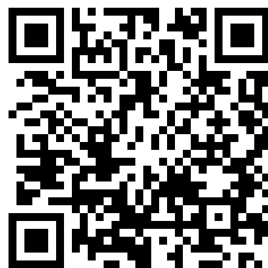
↑ 報名網站 QR code ↑