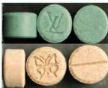
MDMA、MDA、PMMA 等安非他命類毒品