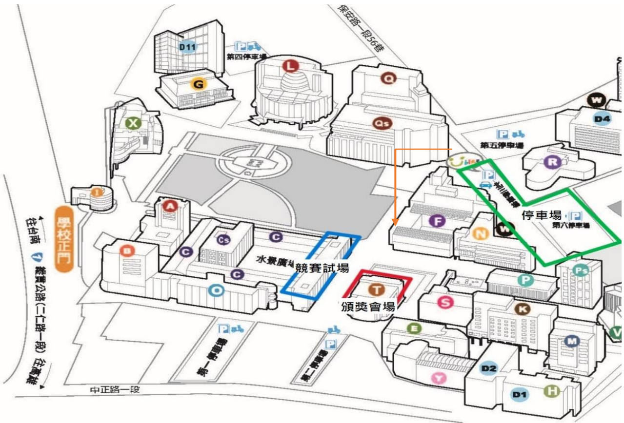
圖1、活動會場動線圖