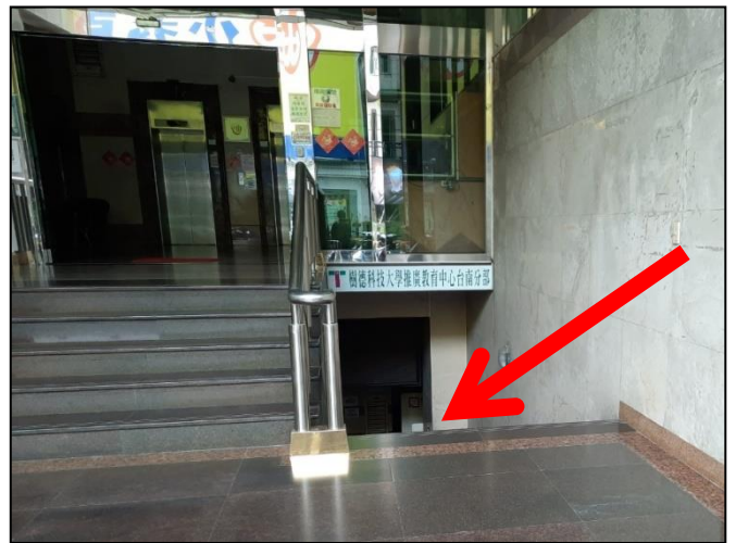
入口處位於右側樓梯