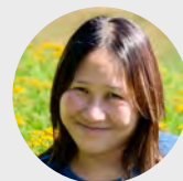
哈佛 Project Zero 計畫主持人 Flossie Chua

雙橡教育 始終相信學習是有用、有趣、有意義的事，它能讓人找到安身立命的工作，有能力打造自己的未來。雙橡自 2017 年起，開始往芬蘭、哈佛取經，打造出許多結合東西方特色的專案課程，因而獲親子天下創新 100，並啟動多個社會影響力活動，包含 See Think Wonder 思考挑戰賽 。