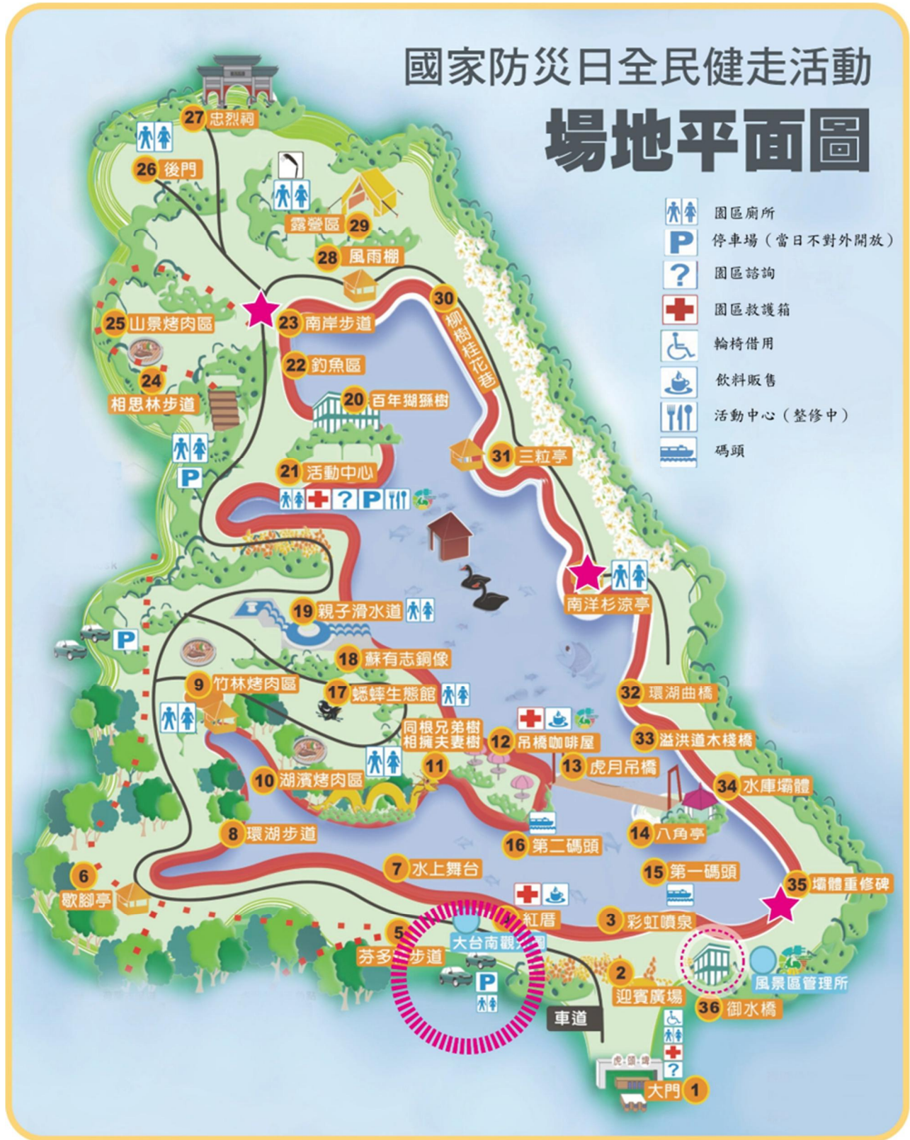
附件一：國家防災日全民健走活動場地平面圖