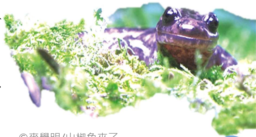
◎麥覺明/山椒魚來了

對於生活環境，山椒魚可是很挑的。暖化會壓迫他們的生存空間，讓這群嬌小、體長約十公分的遠古貴客，更瀕臨滅絕。環境好，生命自然蓬勃。見微知著，觀察他們的消逝，也是看著自己的命運。扭轉奇蹟？或許還來的急，但動作要快，要下定決心。