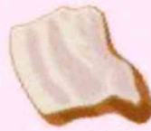
Thịt ướp khô