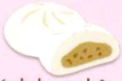
Bánh bao nhân thịt

Bao gồm các loại Lạp xương, thịt xông khói, giăm bông, thịt muối, chà bông, thịt viên, thịt đóng gói, trứng cuộn.