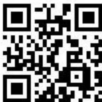
Google 線上報名網址 QR-Code

(二)報名系統網址： https://reurl.cc/3ORlyX (網址英文字之大小寫需一致)