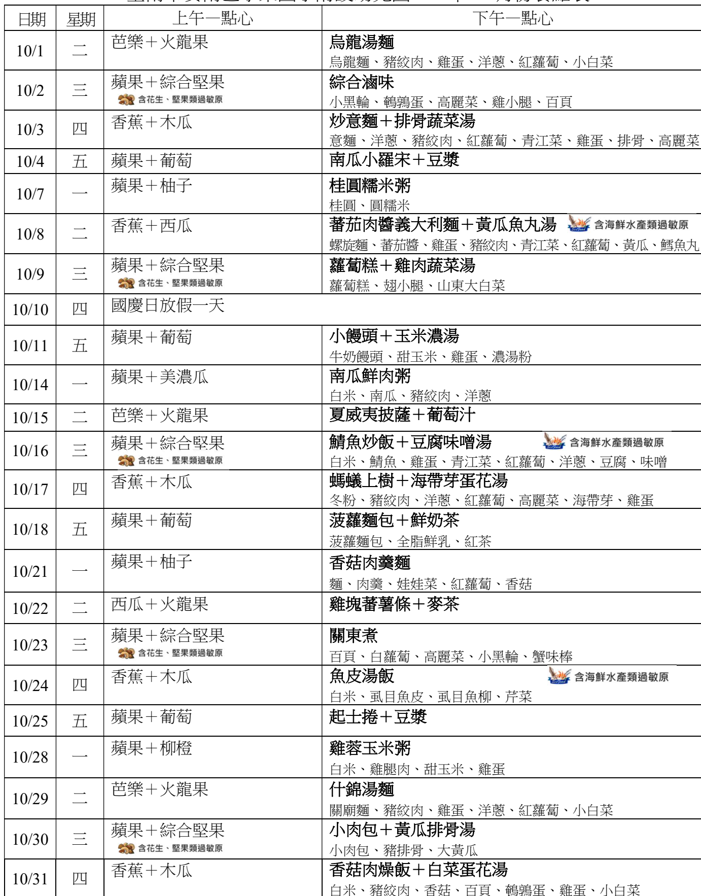
臺南市安南區學東國小附設幼兒園 113 年 10 月份餐點表

備註：1.如遇特殊狀況變動食材，將修正並公告於本校網站（學東國小/學東快訊/幼兒園項下，網址： https://www.htes.tn.edu.tw/ ）請自行前往閱覽，不另通知。