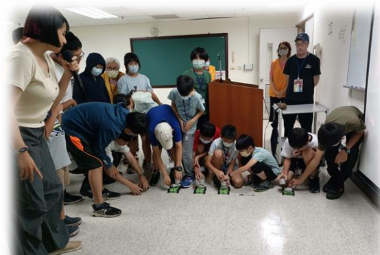
▲科學觀察專注力培養