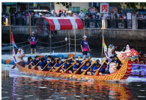
龍舟競賽屢獲佳績