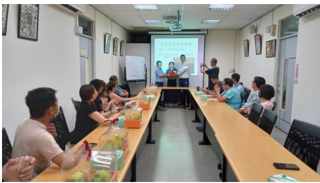
家長會長就職典禮

家長會最主要的功能是協助學校推動各項教學活動，並齊力解決校內的各種突發事件；經年累月以來，公部門對學校經費的補助向來非常有限，但孩子的學習卻不容等待。為了孩子的精進成長、為了教學品質的提升，校長、家長會長與本校教職員工懇請您共同來支持學校，歡迎您加入家長會，共同來為海佃國中盡一份心力。若您因事業繁忙，無暇參與，我們亦歡迎您以愛心捐款方式來支持校務運作。