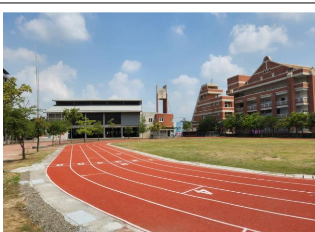
操場 PU 跑道重建

近年來學校努力爭取經費，相繼完成「校舍地磚改善工程」、「監視器系統改善工程」與「圖書室空間改善工程」等重要建設，提供全校師生安全舒適的活動空間。並配合市政府政策進行「新設幼兒園空間改善工程」，提供全新教學環境及完善教學設備，課程多元活潑，以滿足幼兒多樣性的學習需求。另外為滿足學生多元學習需求新設童軍野炊區、射箭場、教室冷氣裝設、操場 PU 跑道，其中光電停車場、籃球場已於 112 年 5 月底完工啟用。本校 113 年之重大工程有郡安路、富東路通學步道改建、第一、二、三期老舊男廁所改建，皆已完工提供全體師生更優質的學習環境與教育空間。