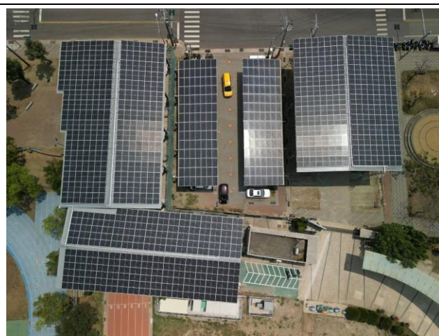
光電籃球場與停車場