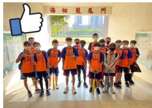
榮獲 TEEBALL 錦標賽亞軍