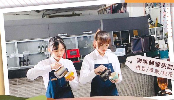
咖啡師證照訓練 烘豆/萃取/拉花