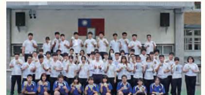
4張以上證照達人合照