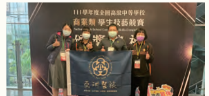
商業類科技藝競賽雙優勝