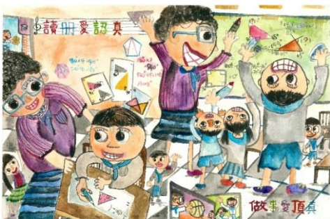
正面：四開畫紙、橫向創作

二、作品規格：請以四開畫紙(材質不限)，進行橫向、單面創作，並於背面右下角黏貼 A4 尺寸報名表，違者不予評選。