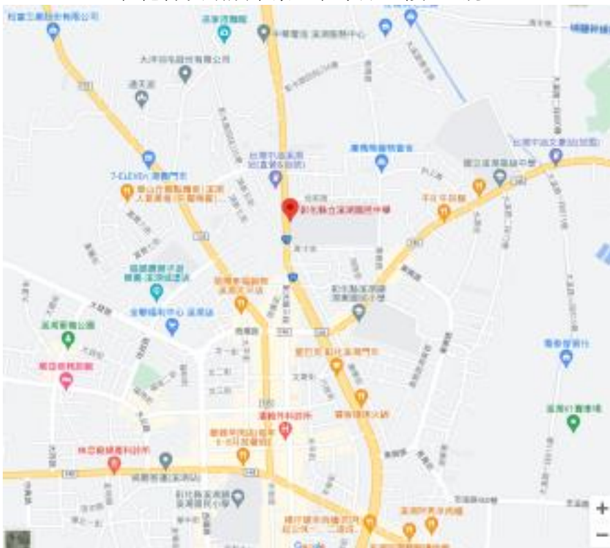
(溪湖國中 google 地圖)