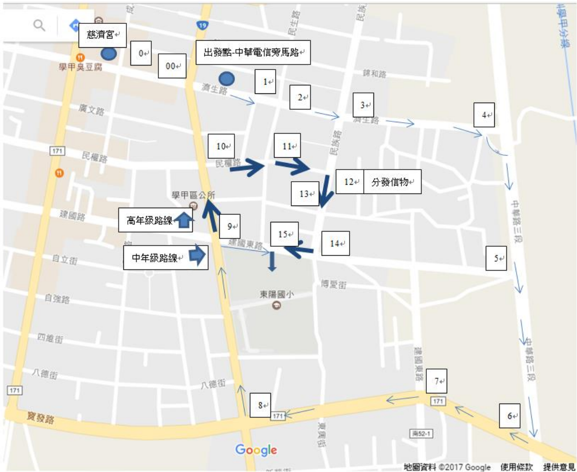
慈濟宮報到祈福熱身活動暨起跑配置圖