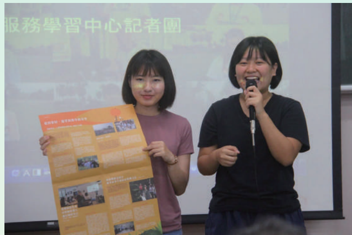
▲ 詠庭及育恩在記者團招募說明會中，與學弟妹分享獲取的收穫及成長