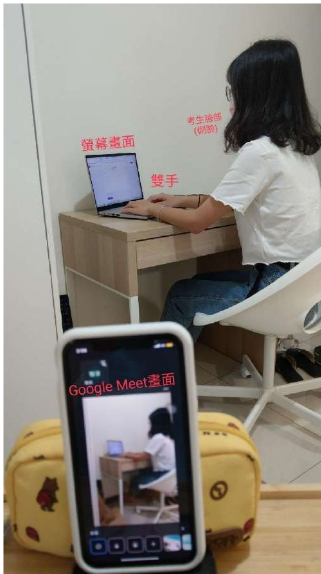
圖三、以手機呈現應試環境於 google meet 線上監考網址