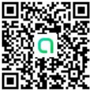
活動 Line 社群 QR code

敬請加入學會競賽 Line 社群： https://reurl.cc/NpGqK6