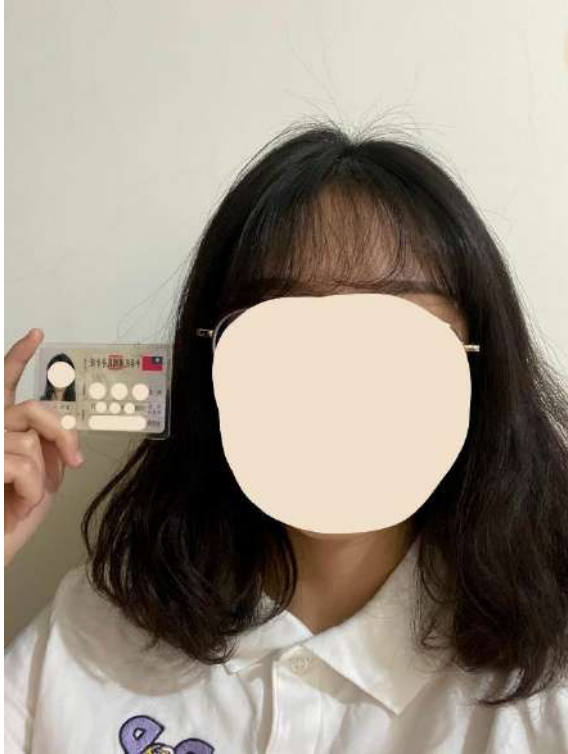
圖四、身份驗證畫面示意圖