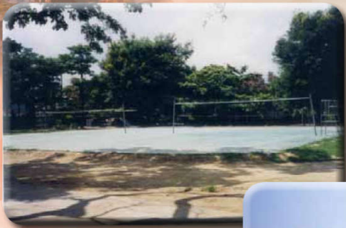
在操場中央增建球場