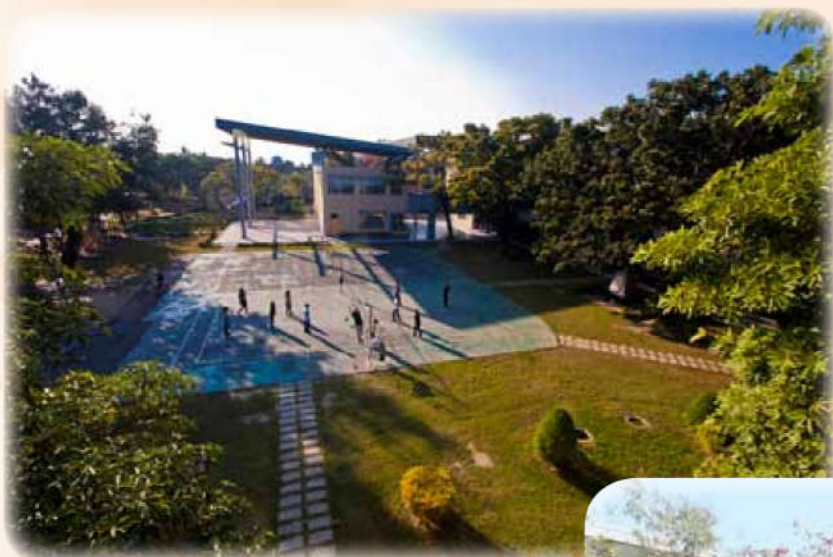
校地擴增後，將操場移至新校地，原有跑道植草並鋪設石板路