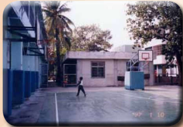
北邊教室後的空地闢 為籃球場