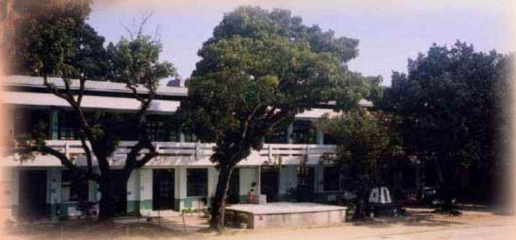
原升旗台夷平為草地，新升旗台位在新校地