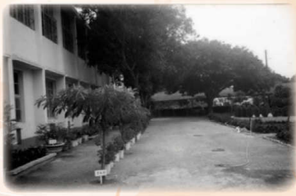
砍除樹木，拓寬小徑