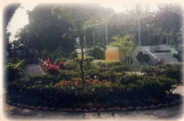
拆除宿舍，增建花台、步道