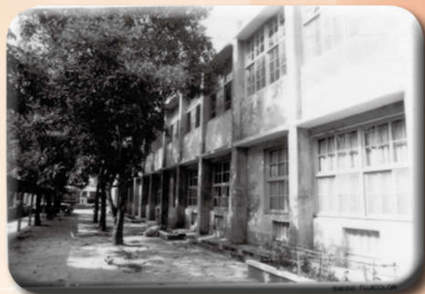
宿舍旁的林蔭小徑