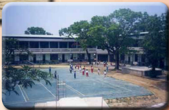
排球場周邊跑道仍是 黃沙漫漫