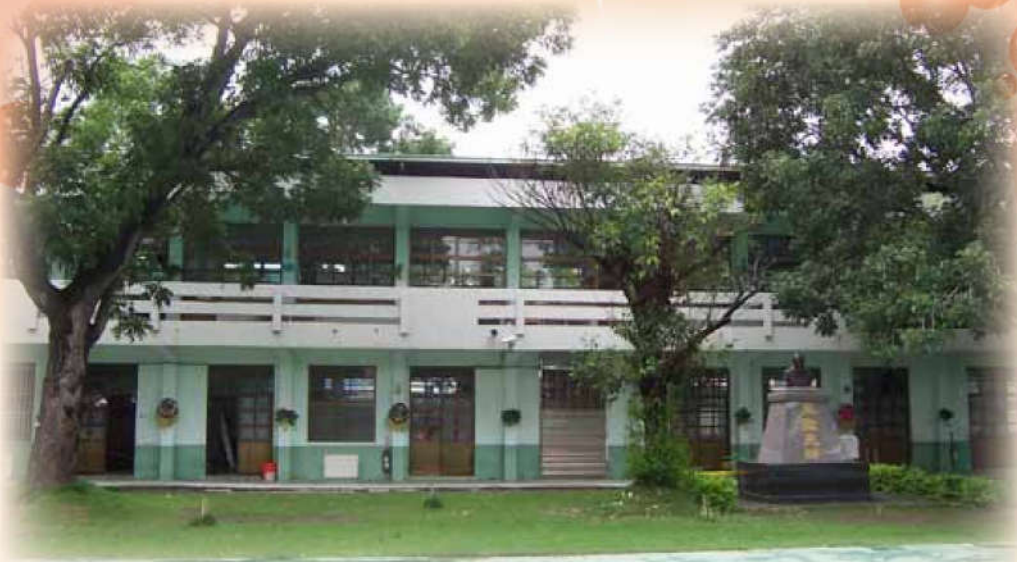
不曾移動的是一孔子銅像，只將基座修整美化