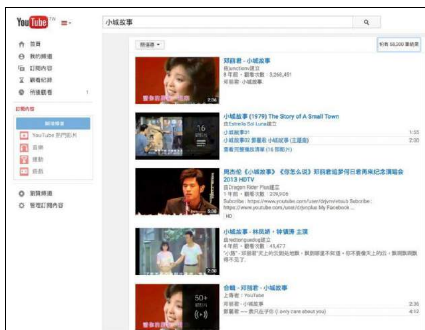
部分影片因授權問題，將會從YOUTUBE搜尋歌曲。