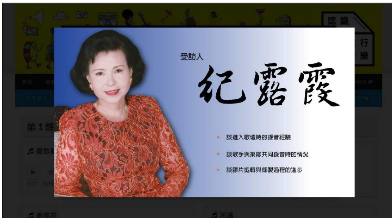
課程自製與採訪影片可於線上直接播放