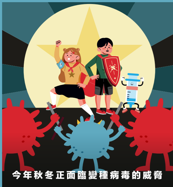
今年秋冬正面臨變種病毒的威脅