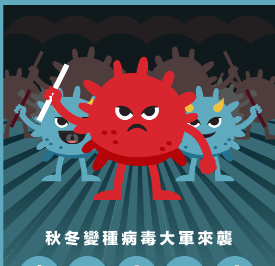
秋冬變種病毒大軍來襲