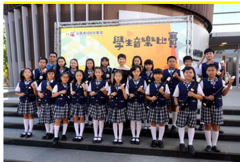
直笛比賽榮獲乙組優等