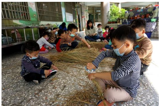
百年校慶裝置藝術-剪稻草初體驗