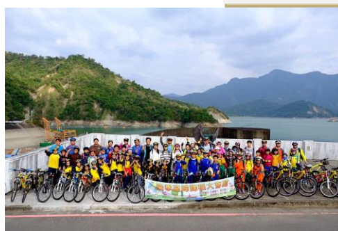
四年級-曾文水庫單車大會師