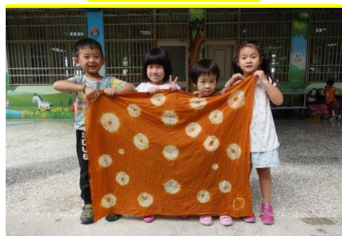
這是我們的作品喔~