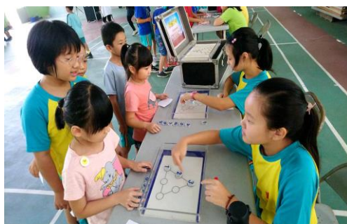
科教館科學闖關活動