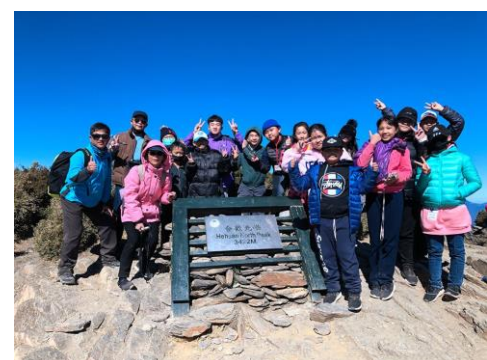
六年級-攀登台歡山北峰