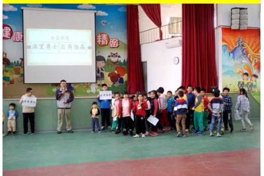
百年校慶裝置藝術-命名票選