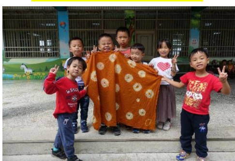
YA~這是我們的作品喔~