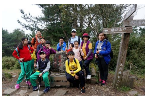
五年級山野教育攀登鹿林山