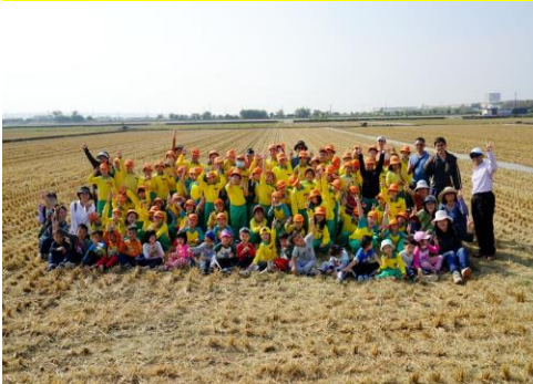
百年校慶裝置藝術-撿稻草初體驗