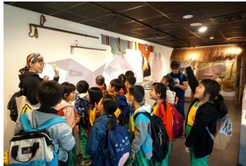
處處即教室--認識西拉雅文化