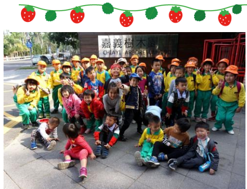
低年級及幼兒園蘭潭生態之旅