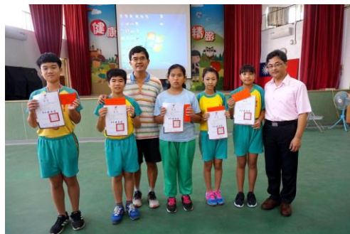
市長盃國小田徑錦標賽榮獲佳績