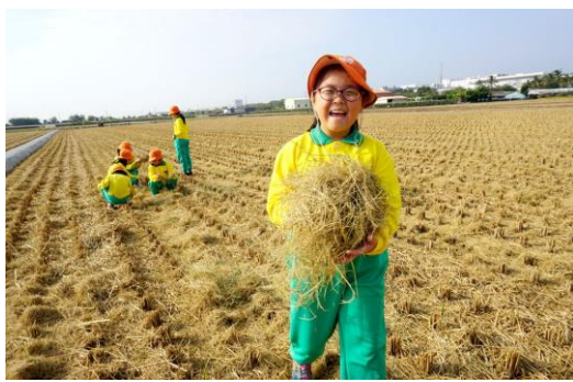
百年校慶裝置藝術-撿稻草初體驗