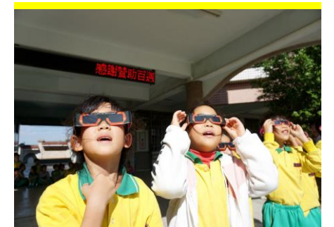
生活即課程--日偏食觀察