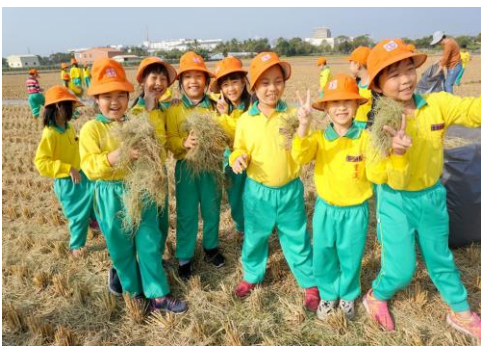
百年校慶裝置藝術-撿稻草初體驗