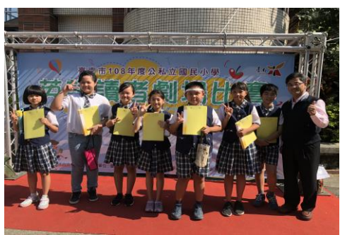
英語讀劇比賽表現優異