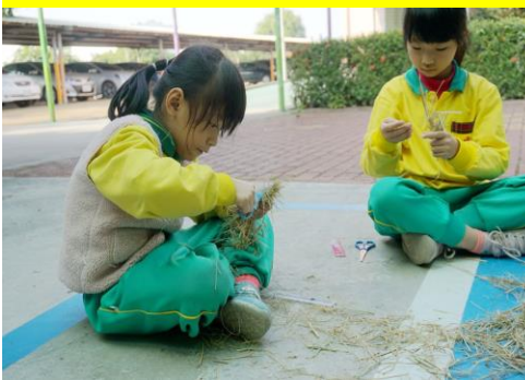
百年校慶裝置藝術-剪稻草初體驗