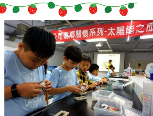
中年級高雄科工館太陽之旅