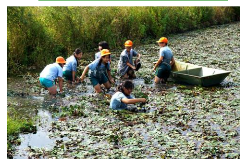
認識家鄉--走出教室採菱角