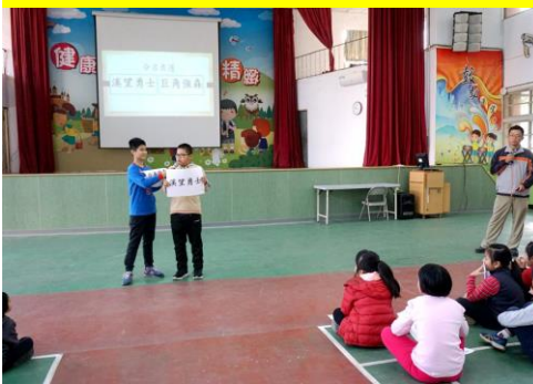
百年校慶裝置藝術-命名票選