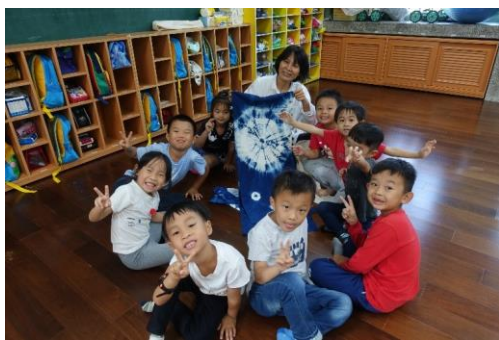
會變色的染布好神奇喔~