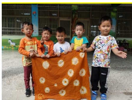
這是我們的作品喔~