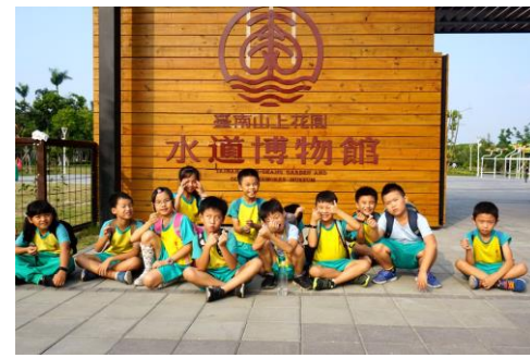
三年級孩子開心合影