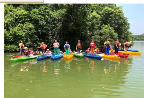
五年級-獨木舟大會師