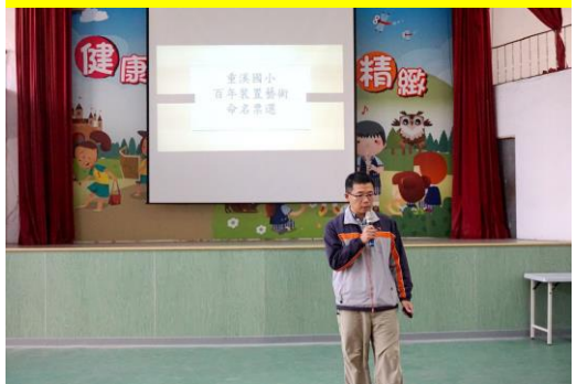
百年校慶裝置藝術-命名票選