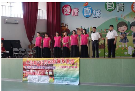
你是我的眼-愛樂視障合唱團演出