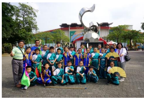
傳統藝術比賽表現亮眼