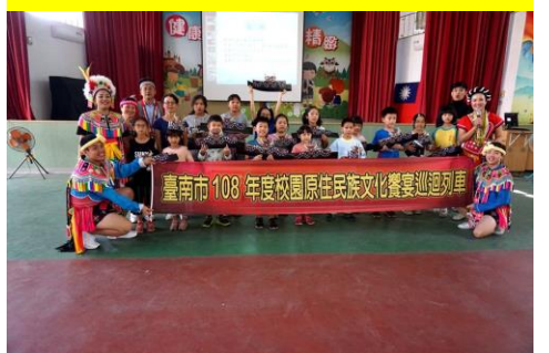
多元課程--原住民文化巡迴列車