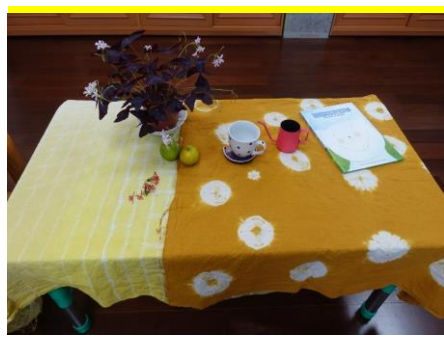
教室變得更美麗喔~