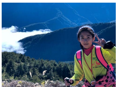
六年級挑戰自我--攀登台歡山北峰