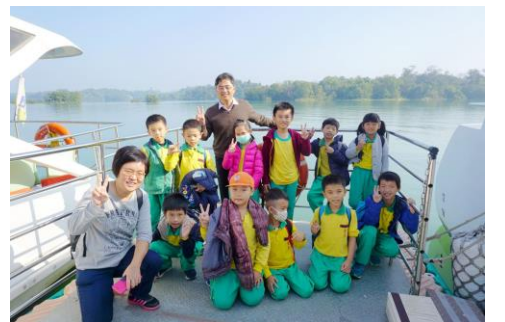
二年級-烏山頭水庫踏查