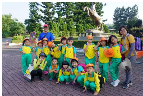
一年級-走馬瀨生態之旅