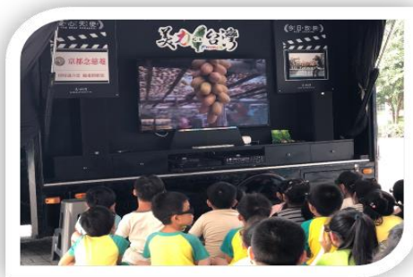
有趣的水媽媽劇團節能宣導