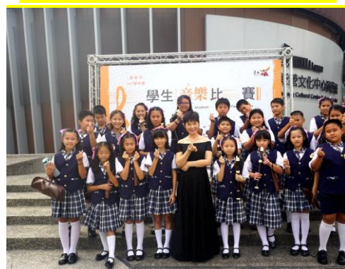
直笛比賽榮獲乙組優等