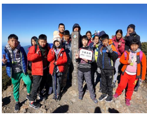
挑戰自我--重溪團仔真棒!!