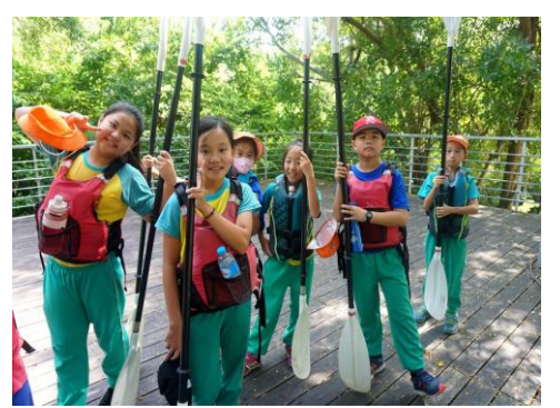
五年級-獨木舟大會師