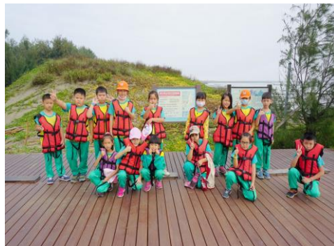
三年級-七股潟湖鹽博館之旅