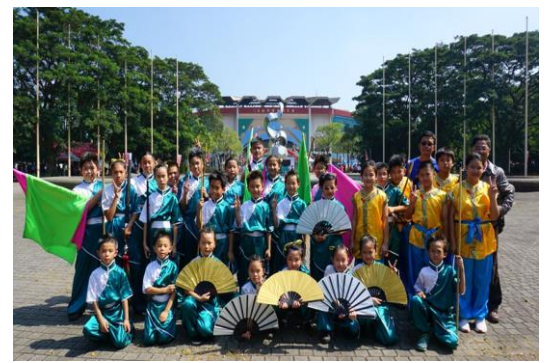
傳統藝術比賽表現亮眼