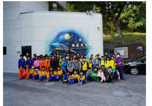
四年級-走訪南瀛天文台