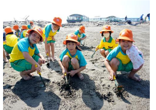
體驗赤腳踩在沙灘上的新鮮