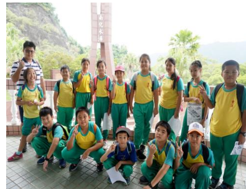
五年級-南化水庫烏山獼猴保護區