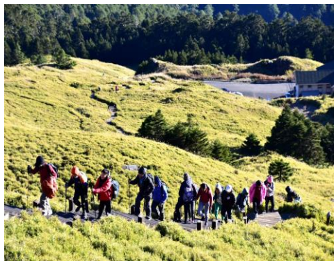
六年級-畢業旅行挑戰合歡山東峰