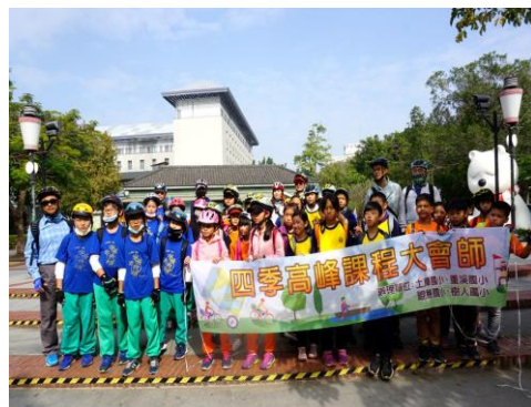
四年級-單車大會師