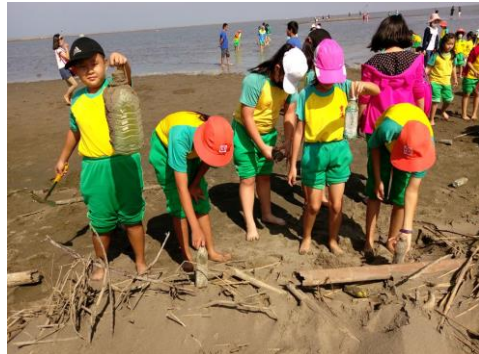
愛護海洋-我們來淨灘