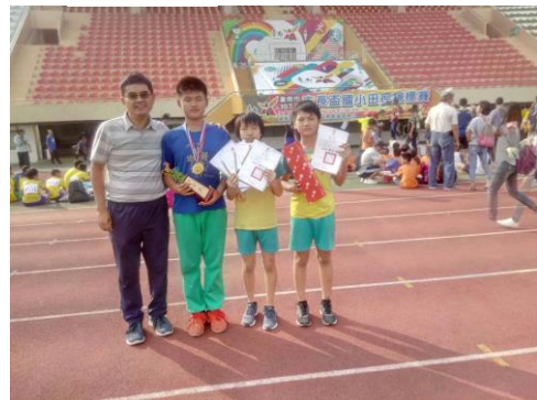
市長盃田徑賽榮獲總錦標第一名