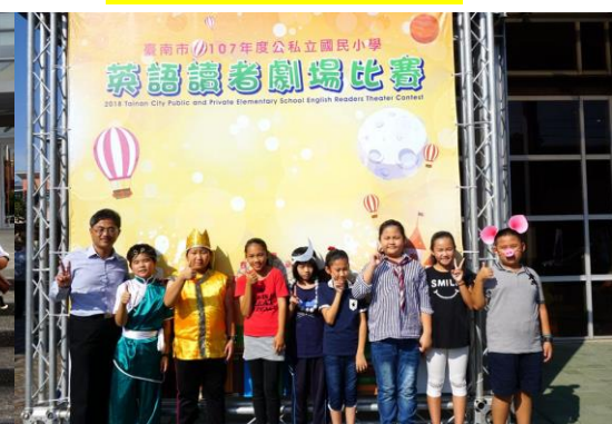
英語讀劇比賽表現優異