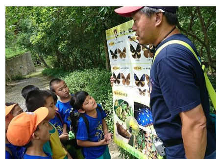
▲低年級紅葉公園、水火同源生態教育校外教學