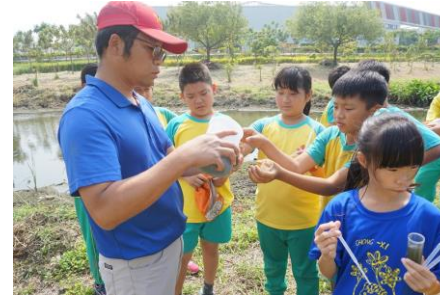
▲高年級柳科園區水質監測、學習使用空拍機