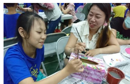
~母親節親子DIY 彩繪「綠麻吉面紙盒」活動~