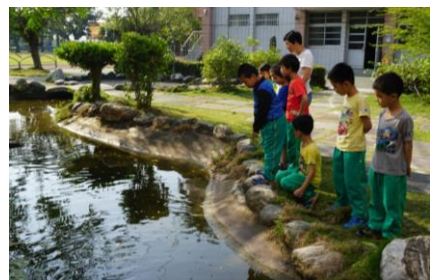
▲低年級認識水域安全