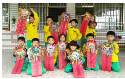
▲低年級健康標語獅頭作品