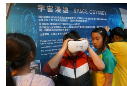
▲南瀛天文臺 VR 體驗