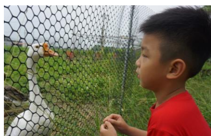
▲親近動物，關懷生命