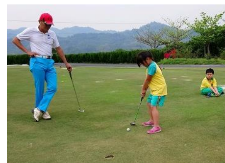
～高爾夫球社移師斑花球場，異地集訓～