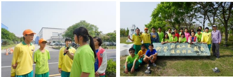
重溪國小粉絲專頁

做完了這兩項活動以後，我覺得陳雅琳主播很勇敢，在大家都不敢去日本的時候，只有她要去；大登公司則默默的清理環境。這些都是默默幫忙社會的例子，所以我希望以後也能默默的幫助社會，帶給別人愛心與關心。