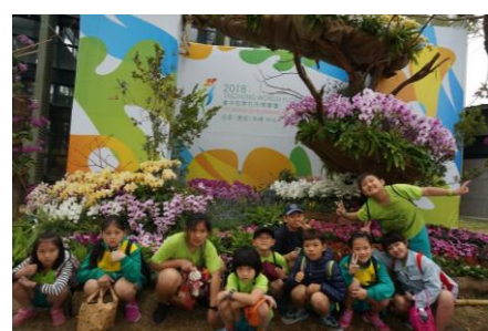
▲中年級國際蘭展參觀與定向越野教學