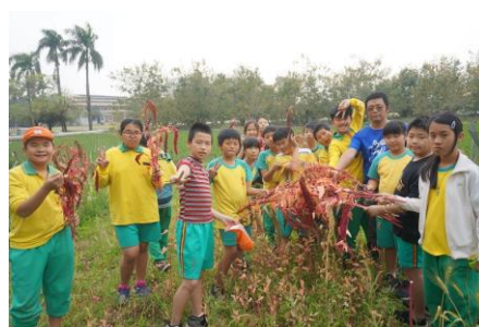
▲高年級栽植紅藜、製作紅藜飯