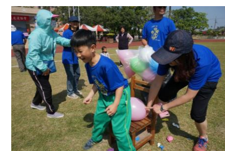
~校慶親子趣味競賽、統一獅隊吉祥物—萊恩同歡~