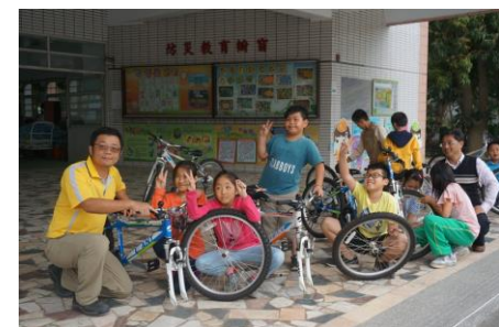
▲中年級單車走讀、參訪「八田與一紀念館」