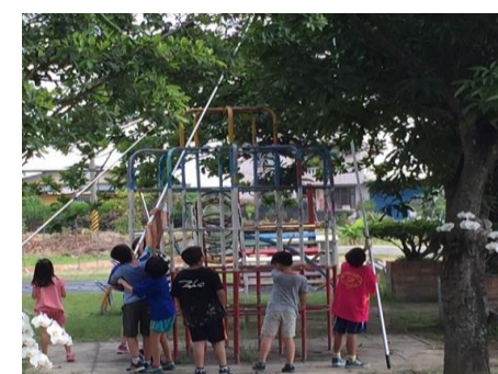
▲中年級打芒果、製作芒果青（情人果）