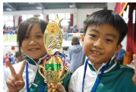
▲港都盃武術錦標賽，榮獲佳績