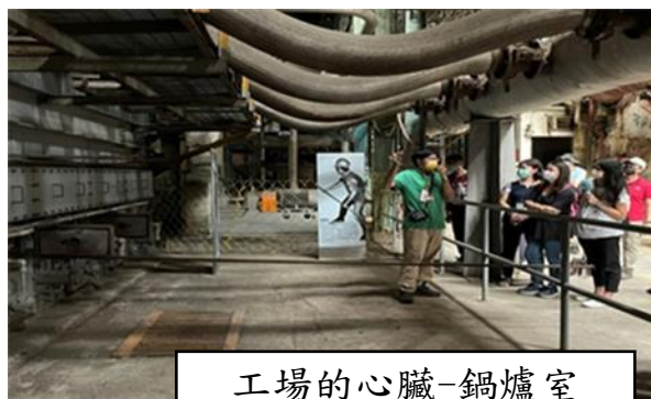
工場的心臟-鍋爐室