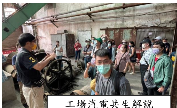
工場汽電共生解說