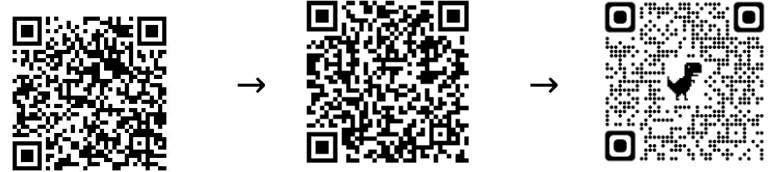
1. 報名流程教學 2. 社團報名網 3. 確認是否報名成

1. 開啟線上報名網頁 https://act.cmes.tn.edu.tw/modules/kw_club/ (公告於校網)。